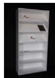
Estantería baldas mixtas