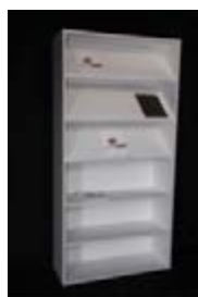
Estantería baldas mixtas