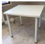
M 01_ Mesa cuadrada de 70 x 70 cm. TARIFA: 42 €