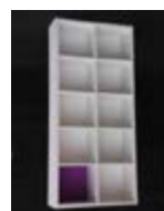
E 01_ Estantería 10 baldas rectas 80 x 30 x 200 cm TARIFA: 42 €