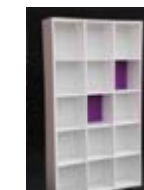
E 02_ Estantería 15 baldas rectas 120 x 30 x 200 cm. TARIFA: 54 €