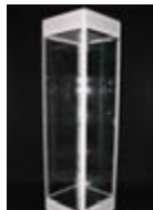
MO 07_ Vitrina acristalada alta 50 x 50 x 180 cm. TARIFA: 72 €