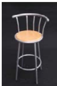
S 04_ Taburete de madera TARIFA: 27 €