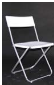
S 01_ Silla plegable blanca TARIFA: 5 €