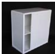
MO 01_ Mostrador cerrado de 100 x 50 x 100 cm. TARIFA: 42 €