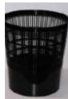
V 07_Papelera TARIFA: 3 €