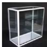
MO 05_ Mostrador acristalado 100 x 50 x 100 cm. TARIFA: 54 €