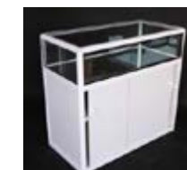
MO 04_ Mostrador vitrina 100 x 50 x 100 cm. TARIFA: 48 €