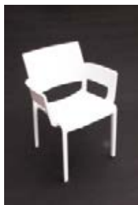
S 03_ Silla PVC con brazos blanca TARIFA: 22 €