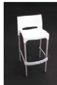
S 05_ Taburete blanco TARIFA: 27 €