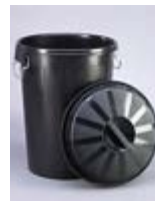
V 06_Cubo basura industrial TARIFA: 9 €