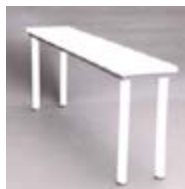
M 02_ Mesa alargada de 200 x 40 cm. TARIFA: 48 €