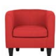
S 06_ Butaca roja TARIFA: 72 €