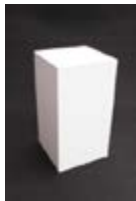
V 01_Podium 40 x 40 x 110 cm. TARIFA: 24 €