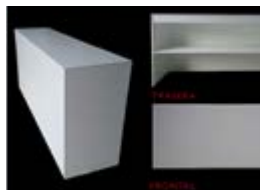
MO 03_ Mostrador cerrado de 200 x 50 x 100 cm. TARIFA: 48 €