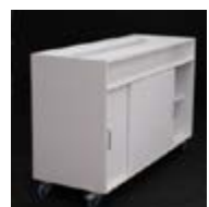
MO 06_ Mostrador diseño con ruedas 160 x 60 x 100 cm. TARIFA: 72 €