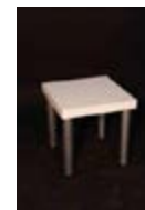
M 04_ Mesa baja de 40 x 40 cm. TARIFA: 30 €