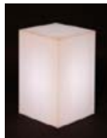
V 03_Cubo luminoso TARIFA: 30 €