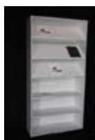
E 04_ Estantería mixta: Baldas rectas e inclinadas 100 x 30 x 200 cm TARIFA: 48 €