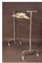
V 05_Burro para ropa TARIFA: 24 €