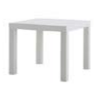
M 05_ Mesa lack de 55 x 55 cm. TARIFA: 7 €