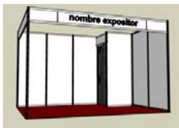
AL 01_ Almacén con puerta plegable 100 x 100 cm. TARIFA: 64 €

Sólo se garantiza el suministro de los productos y servicios contratados antes del día 20 de octubre de 2017. Posteriormente, se incrementará el importe en un 10%