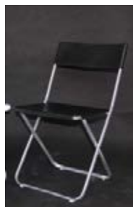
S 02_ Silla plegable negra TARIFA: 5 €