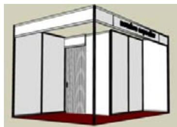
AL 03_ Almacén con puerta plegable 200 x 200 cm. TARIFA: 100 €