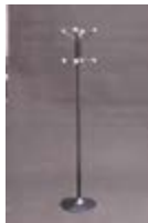
V 04_Perchero TARIFA: 12 €