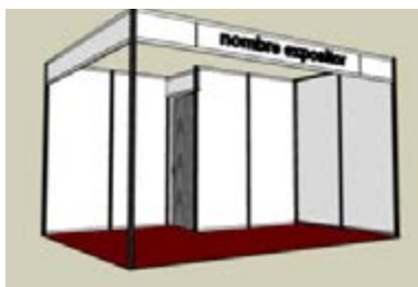
AL 02_ Almacén con puerta plegable 200 x 100 cm. TARIFA: 82 €