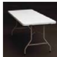
M 06_ Mesa tablero de 180 x 80 cm. TARIFA: 22 €